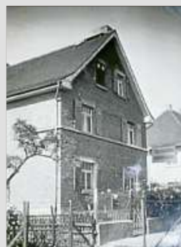
Das Elternhaus in der Friedensstraße 39.